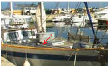
Borda o Regala