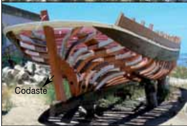
Estructura de un barco