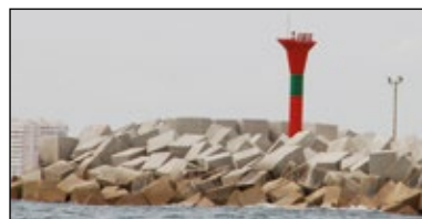
Marca lateral de bifurcación canal principal a estribor