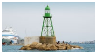
Marca lateral de estribor verde