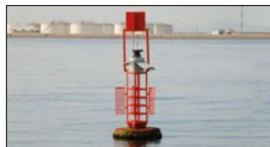
Marca lateral de babor de color rojo

Si en la bifurcación, el canal principal está a babor , la marca lateral de bifurcación será de forma cónica , de castillete o espeque, de color verde , con tope cónico verde y llevará una franja roja en el centro de la marca, indicativa de que el canal principal está a babor. De noche, la luz será verde y la fase 2+1 destellos .