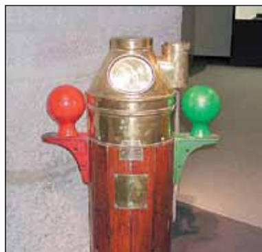
Bitácora de una embarcación tradicional