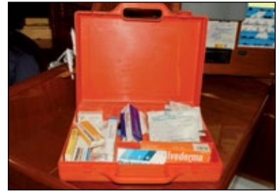
Botiquín tipo balsa salvamento.