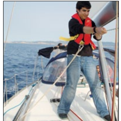
Árnés de seguridad incorporado a un chaleco hinchable

El riesgo principal de un arnés es la posibilidad de ahogarse para el hombre que ha caído, aunque este supuesto es fácil de evitar si en cubierta hay siempre más de un tripulante.