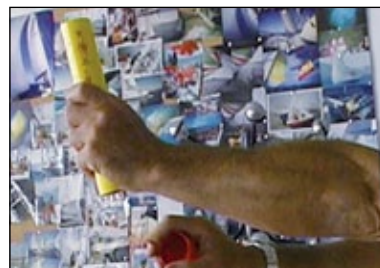
Cohete con paracaídas