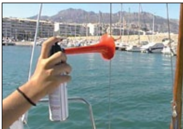
Bocina de niebla.