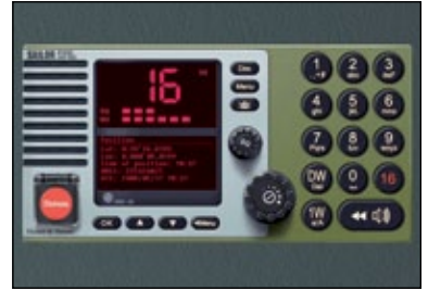
Equipo de VHF con llamada selectiva digital.

Un botiquín: Las embarcaciones autorizadas para la Zona de navegación 5, deberán contar con el botiquín tipo número 4. Las embarcaciones autorizadas para la Zona de navegación 4, deberán contar con el botiquín tipo "balsa de salvamento". El material médico y los medicamentos se reseñan en la página 56.