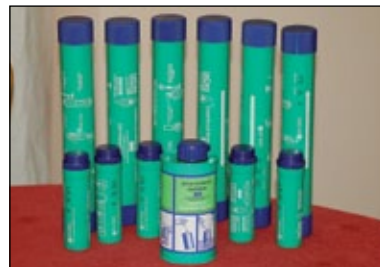
Juego de señales para zona 4 de navegación

En cuanto la señal fumígena flotante, despide un humo de color naranja butano. Una vez disparada se lanza al agua.