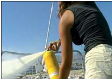
Extintor de polvo seco.