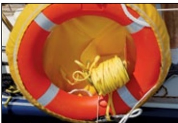
Aro salvavidas con funda.

El gran inconveniente del aro salvavidas es que su estiba y la rabiza se enredan permanentemente. En este sentido, es fundamental adquirir una bobina para llevar instalado el cabo y que éste salga sin dificultad.