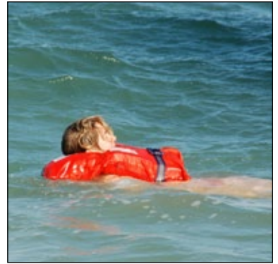
Chaleco salvavidas convencional

Se sujetan mediante cinchas y su principal función es la de evitar que un hombre caído al mar e inconsciente se ahogue. También mantienen la cabeza fuera del agua y nos permite flotar sin esfuerzo.