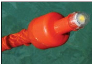
La luz se enciende cuando la boya se adriza.