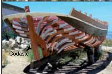
Estructura de un barco