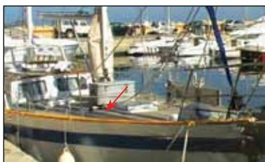
Borda o Regala